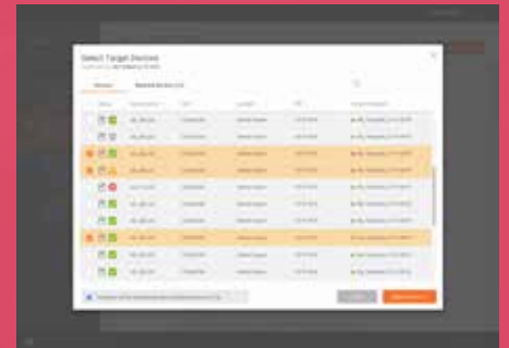
Updates werden an ausgewählte Gerätegruppen gesendet