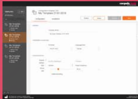
Gerätekonfigurationen werden direkt im Browser erstellt