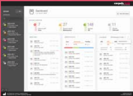
Übersichtliches Dashboard zeigt den Status aller Geräte

Mit corpuls.web MANAGER halten Sie Ihre corpuls aed stets im Blick. Nach den regelmäßigen Selbsttests stellen Ihre Geräte automatisch die Verbindung zu Ihrem Server her. Mit einem beliebigen Webbrowser können Sie den aktuellen Status in corpuls.web MANAGER einsehen und sofort zu wartende Geräte identifizieren – ohne in der Nähe der Geräte sein zu müssen.